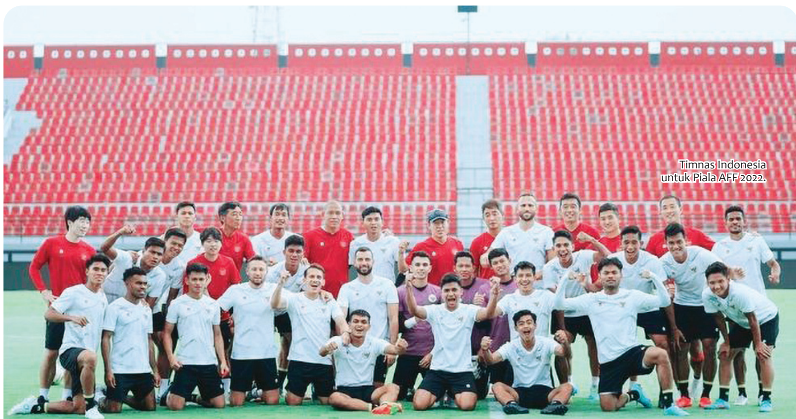
Timnas Indonesia untuk Piala AFF 2022.