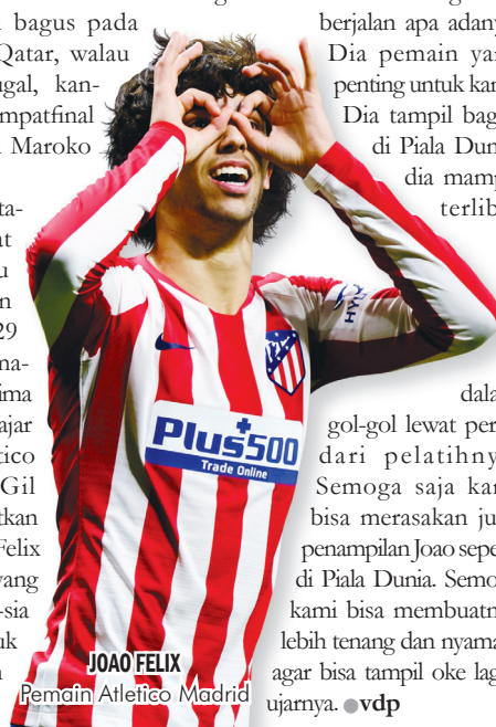
JOAO FELIX Pemain Atletico Madrid

dalam gol-gol lewat peran dari pelatihnya. Semoga saja kami bisa merasakan juga penampilan Joao seperti di Piala Dunia. Semoga kami bisa membuatnya lebih tenang dan nyaman, agar bisa tampil oke lagi," ujarnya. ●vdp