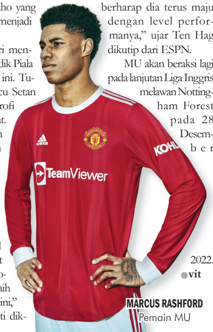
MARCUS RASHFORD Pemain MU

MU akan beraksi lagi pada lanjutan Liga Inggris melawan Nottingham Forest pada 28 Desember.